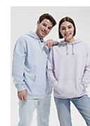
SOL'S CONDOR 03815