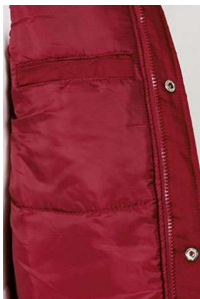
Detalle bolsillo interior en pecho izquierdo