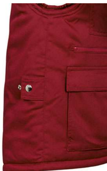
Vista lateral: espalda más larga