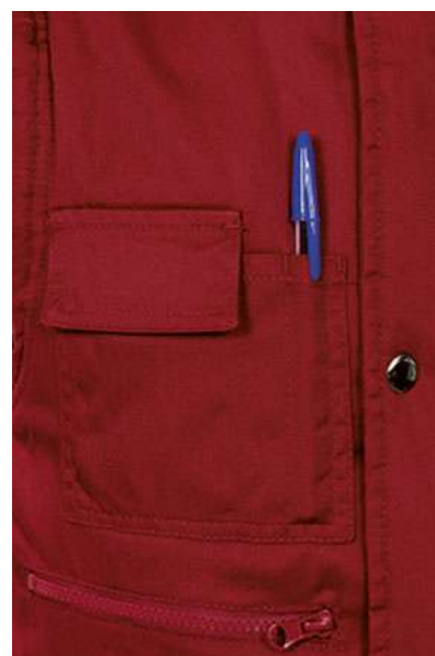
Detalle bolsillo en pecho derecho