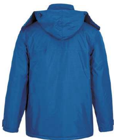
Vista parte trasera de la prenda (espalda)